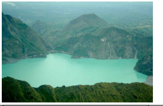
Le volcan en 2005

L'éruption a provoquée des dégâts écologiques et humains. Depuis 1993, la vie reprend le dessus.