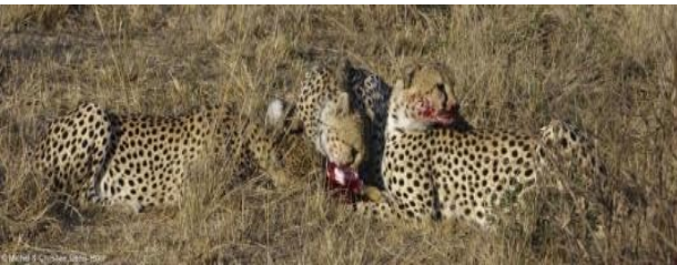
guépards mangeant leur proie

Le guépard est l'animal terrestre le plus rapide mais à ce rythme là il ne peut courir que 500 m.