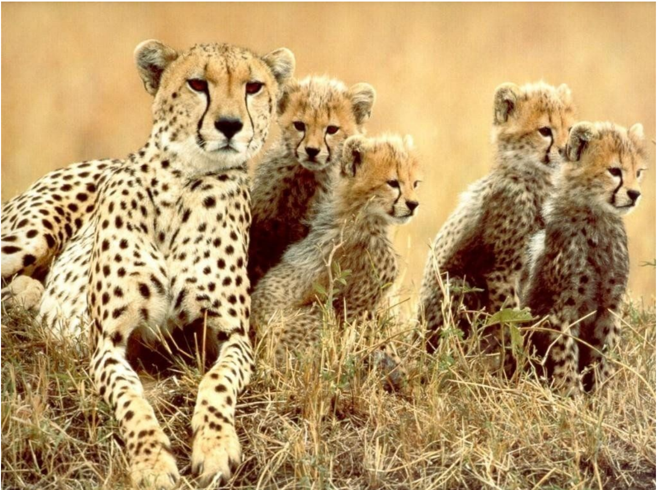
Bébés guépards accompagnés de leur mère

A cause de la compétition avec les autres espèces, la population de guépard est en constante régression.