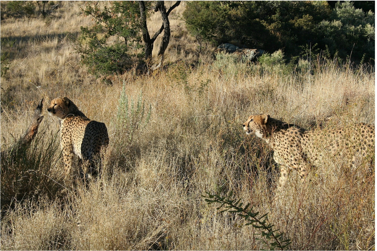
Guépards partants à la chasse,